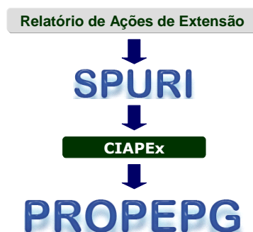
Fig. 1 – Tramitação de relatórios de extensão – Bolsas de Extensão

Particularmente, quanto ao Programa Institucional de Bolsas de Extensão, cabe ao bolsista a inserção dos relatórios parcial e final no SPURI, conforme calendário específico, os quais são avaliados pelo CIAPEX.